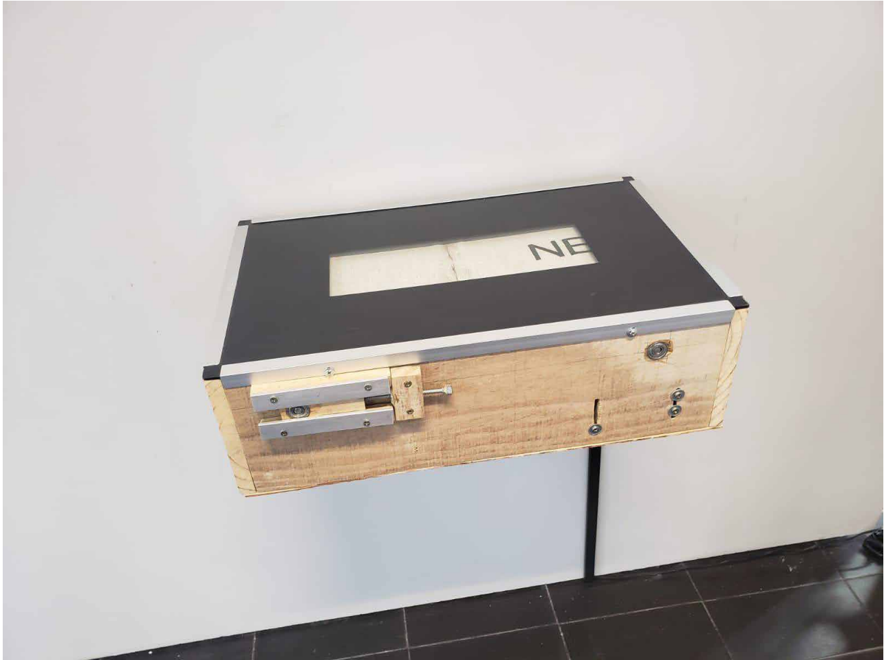
Figura 3: Releitura da Obra: A Redenção de Cam, 2022. 54 X 35 X 17 cm. Objeto motorizado. Madeira e palavras bordadas em tecido com movimento.