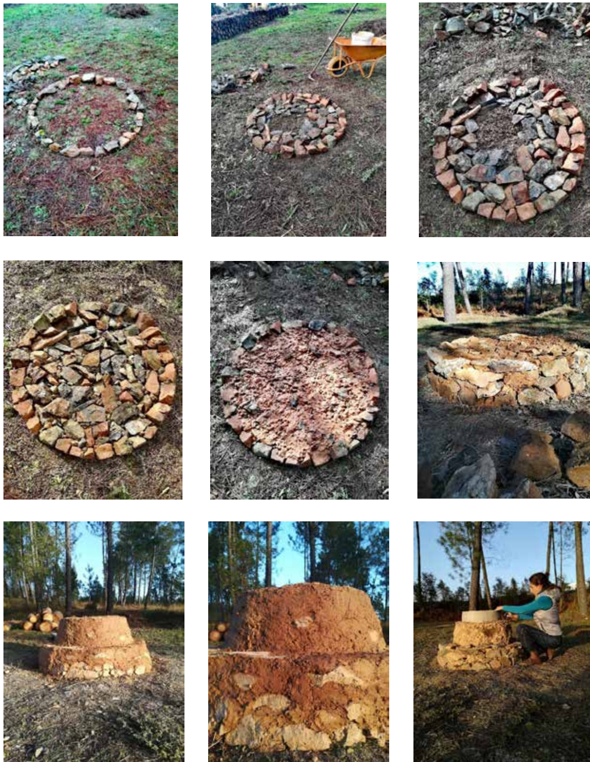
Figura 8. Projeto Sustentar a Chama (detalhes do processo de construção com pedras e argila e início da construção de elemento cerâmico), 2021/2022.