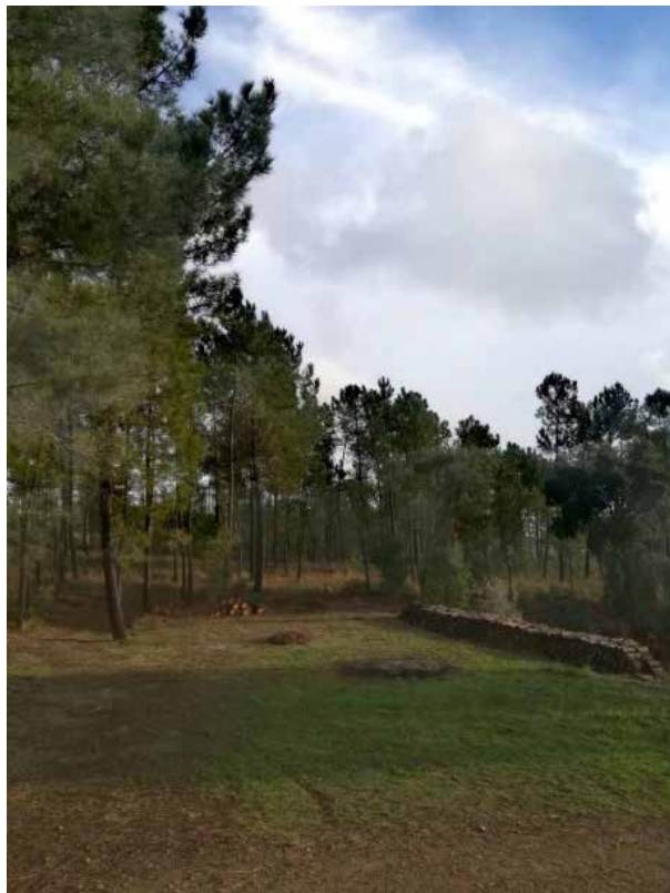
Figura 2. Detalhe da clareira antes da instalação da escultura Sustentar a Chama, Sertã, 2022.