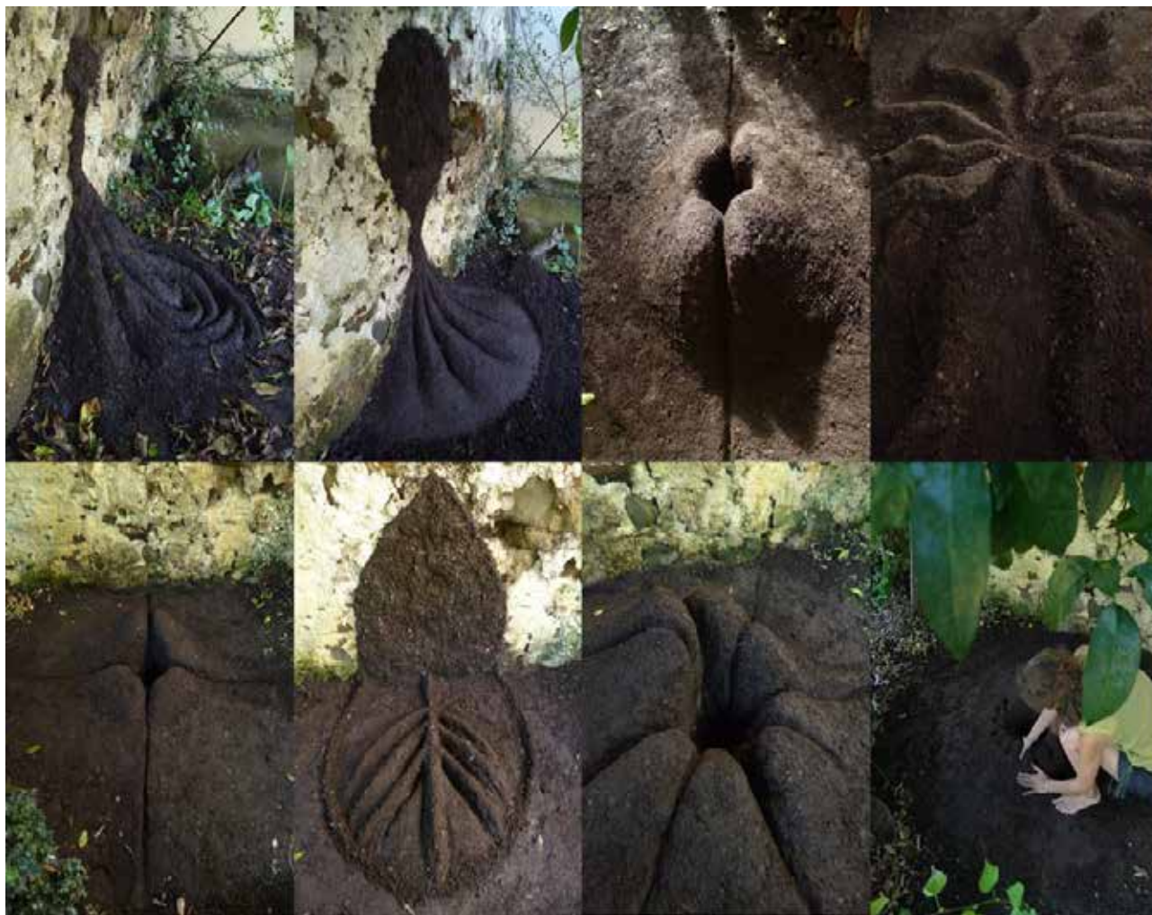
Figura 9. série Alvorada ; esculturas efémeras em terra crua; várias dimensões; 2016. Sara Inácio. Sertã. Fonte: Sara Inácio.