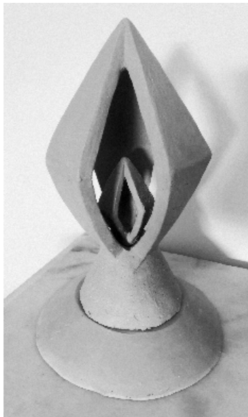
Figura 4. Projeto Sustentar a Chama (início da construção da maquete), Sara Inácio, 2021. Grés, 24 cm (alt). Fonte: Sara Inácio