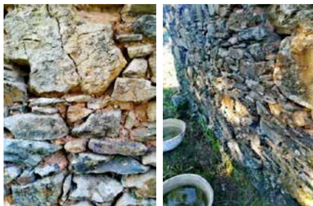
Figura 6. Exemplo de parede construída com pedra e argila. Sertã, 2022.

A construção da parte inferior da escultura, intercalando camadas de pedras e argila crua, teve como inspiração uma técnica antiga local, utilizada para edificar muros, currais, casas e espaços de armazenamento de cereais e outros produtos (Fig. 6). Com exceção do elemento cerâmico, foram utilizadas matérias primas do local (Fig. 7 e 8). Foi a primeira vez que, neste sítio, este método foi utilizado para construir algo que não tem uma utilidade tão óbvia ou imediata como uma parede ou um muro. O mesmo já havia acontecido na obra Alvorada (2016) - em que a terra foi utilizada sem ser para cultivar árvores, vegetais ou flores.