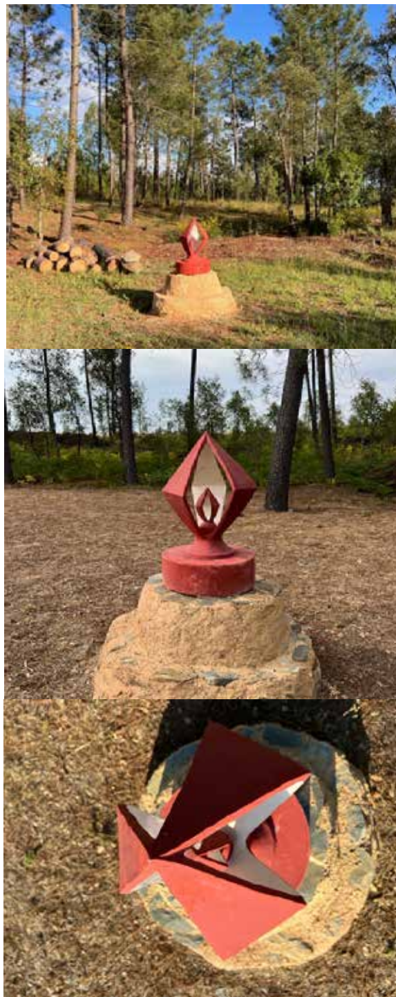
Figura 1. Sustentar a Chama, 2022. Sara Inácio. Argila, pedras, grés, óxido de ferro. Altura: 130 cm.

Sustentar a Chama é uma escultura de carácter mais permanente e evoca o elemento fogo. Está instalada numa clareira da floresta, num espaço onde são realizadas queimas e fogueiras à volta das quais a família se junta (Fig. 2). A ideia para o projeto surgiu como uma imagem no espaço da mente, a partir da vivência do próprio local, do habitar o espaço em vários períodos de tempo, ao longo de muitos anos (Fig. 3 e Fig. 4). O fogo é o centro em torno do qual nos reunimos ciclicamente. Simbolicamente, este elemento está relacionado com o espírito, com o potencial criativo inerente a cada ser humano, com a alegria e a celebração, e está, também, presente na imagem arquetípica da tribo/comunidade/clã reunida à volta da fogueira.