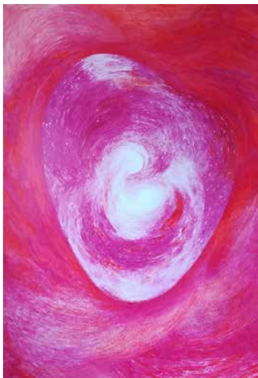
Figura 5. Coração Cósmico (da série Pulsar ). Sara Inácio, 2022. Lápis de cor sobre papel. 100x70cm. (Desenho realizado durante a criação da escultura Sustentar a Chama ).

A intenção, para a criação da escultura, foi a de honrar e homenagear os meus antepassados e, num sentido mais amplo e arquetípico, todos os antepassados, seres humanos e não humanos. Trata-se de um gesto de reconhecimento e de agradecimento por tudo o que é transmitido, continuamente, ao longo de várias gerações: o sangue, o fogo interior, a força de vida pulsante, a sabedoria, o amor e, também, a dor. É um ato poético em reverência à minha família de sangue mas também a todos os ancestrais, ascendentes e descendentes que, ciclicamente, surgem e ressurgem; uma celebração do calor do coração, da conexão intemporal (Fig.5). 2 Embora o processo não tenha decorrido como planeado (uma construção coletiva com toda a família, numa dinâmica meditativa), houve momentos de colaboração de alguns membros - na escolha do espaço da instalação, na recolha e transporte de materiais e em algumas opções estéticas.