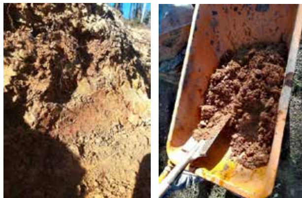
Figura 7. Projeto Sustentar a Chama (detalhes da recolha e preparação da argila), 2021/2022.